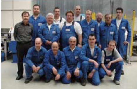
Bohren, schweissen, spritzen, schneiden... Unsere «Torbauer» in der Produktionsabteilung