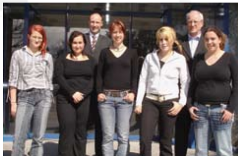
Unentbehrliche Organisationstalente im Hintergrund: Unsere Administration