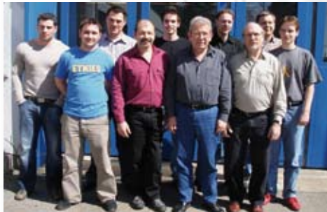
Unsere «Torkünstler» in der Technikabteilung lösen Ihre Torwünsche