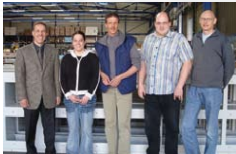
Tunnelblick? Ein Fremdwort für unsere qualifizierte Tunnelabteilung