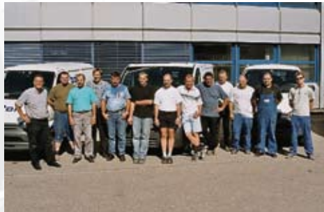
Ready, Set, Go... Immer bereit für den nächsten Einsatz! Unser kompetentes Monteuren-Team